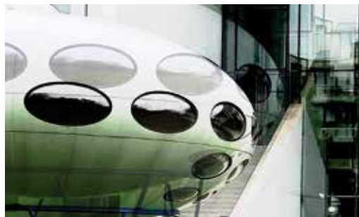
Het Futuro Haus

Deze tentoonstelling met geselecteerde modellen en niet-gepubliceerde ontwerpstudies is ook tijdens de Opti, München te bezichtigen. Het door de Finse architect Matti Suuronen ontwikkelde kunststof Futuro-Haus is gelegen in de tuin van de Pinakothek der Moderne en is ingericht als expositieruimte voor Design Iconen.