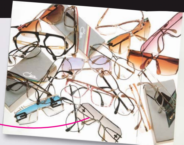
'80年代当時のカタログ