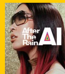
AIのシングル『After The Rain』の初回限定プレス分のジャケット(既に販売終了)ではMODEL904のヴィンテージを着用している