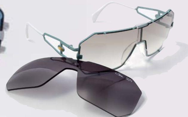
MODEL 904はクリップ型のサングラス・レンズを標準装備。しかし既存のそれとは異なり固定用パーツがデザインと同一化し、外してもまるで違和感がない。これが30年前の発想とは……