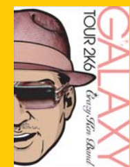
クレイジーケンバンドのDVD『GALAXY TOUR 2K6』。横山剣のイラストの目元にはMODEL856がキラリ。価格5040円

ウィーン芸術アカデミーで建築デザインを学んだ後、75年にカザールを始動。今も現役で才能を発揮する。