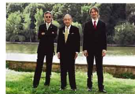
1 Deutsches Filmorchester Babelsberg 2 Paul Kuhn & The Best 3 Paul Kuhn & The Best 4 Paul Kuhn Trio