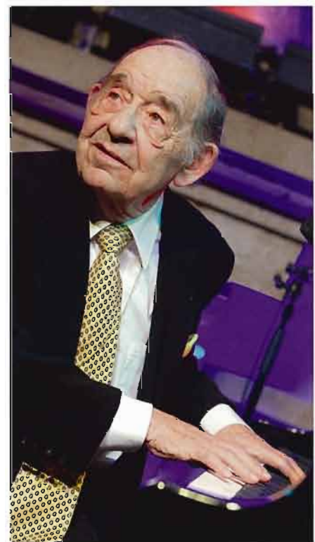
1 Sängerin Gaby Goldberg mit Paul Kuhn live im Café Huber, St. Moritz, 2010 2 Paul Kuhn, Festival da Jazz St. Moritz 2010